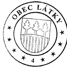
[redacted] Kubiš starosta obce Látky